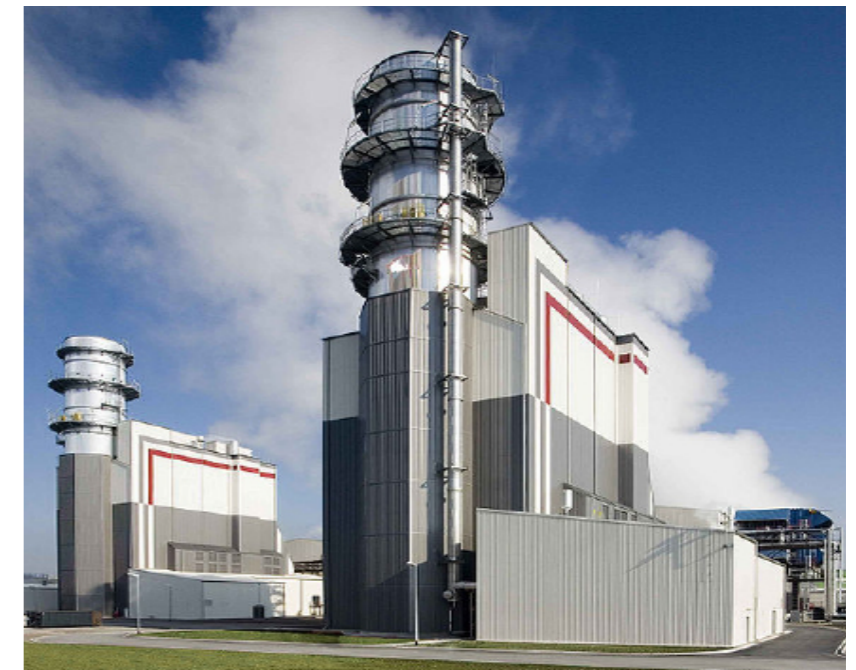
Das GuD-Kraftwerk in Hamm-Uentrop ging 2007 ans Netz.

In einem Gas- und Dampfkraftwerk fährt der Dampfkraftprozess quasi im „Windschatten“ des Gasturbinenprozesses mit. Durch die Verknüpfung beider Technologien lässt sich eine erhebliche Steigerung des Wirkungsgrades von ungefähr 30 % auf nahezu 60 % erreichen. Wird das Kraftwerk mit Kraft-Wärme-Kopplung betrieben, wird zusätzlich zum Strom auch Wärme erzeugt, die z. B. in Form von Fernwärme an Industrie oder Privathaushalte abgegeben werden kann. Dazu wird, je nach Bauart, ein Teil des Dampfes verwendet, um im Kondensator Wasser auf 80–120 °C zu erhitzen. Das heiße Wasser wird anschließend über Rohre ins Fernwärmesystem eingespeist.